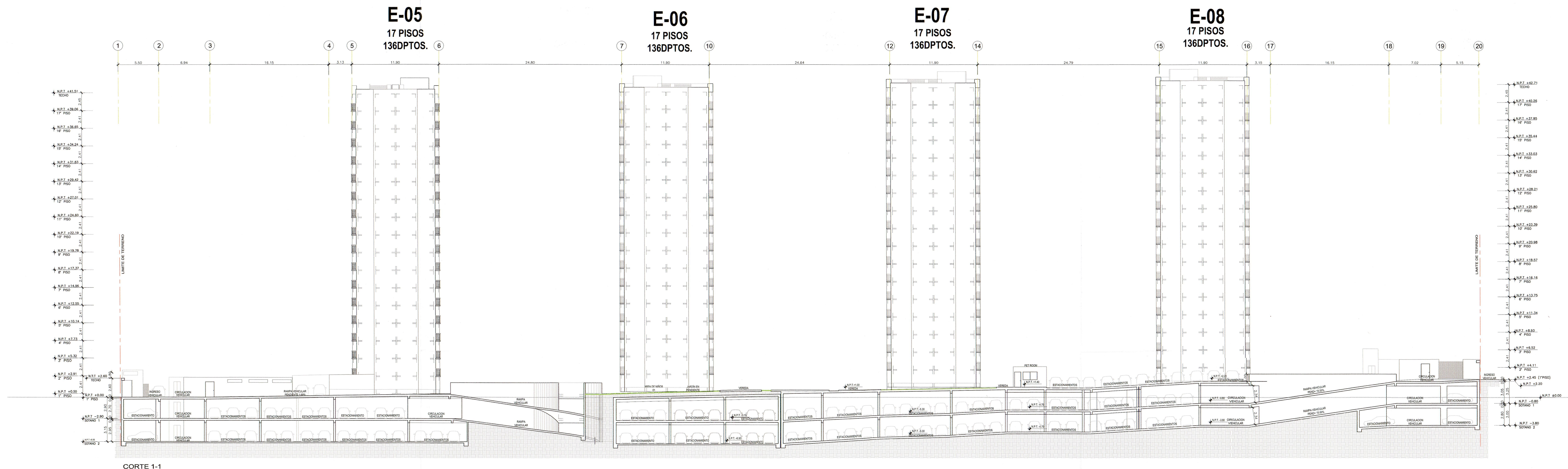
CORTE 1-1 Esc. 1:1000