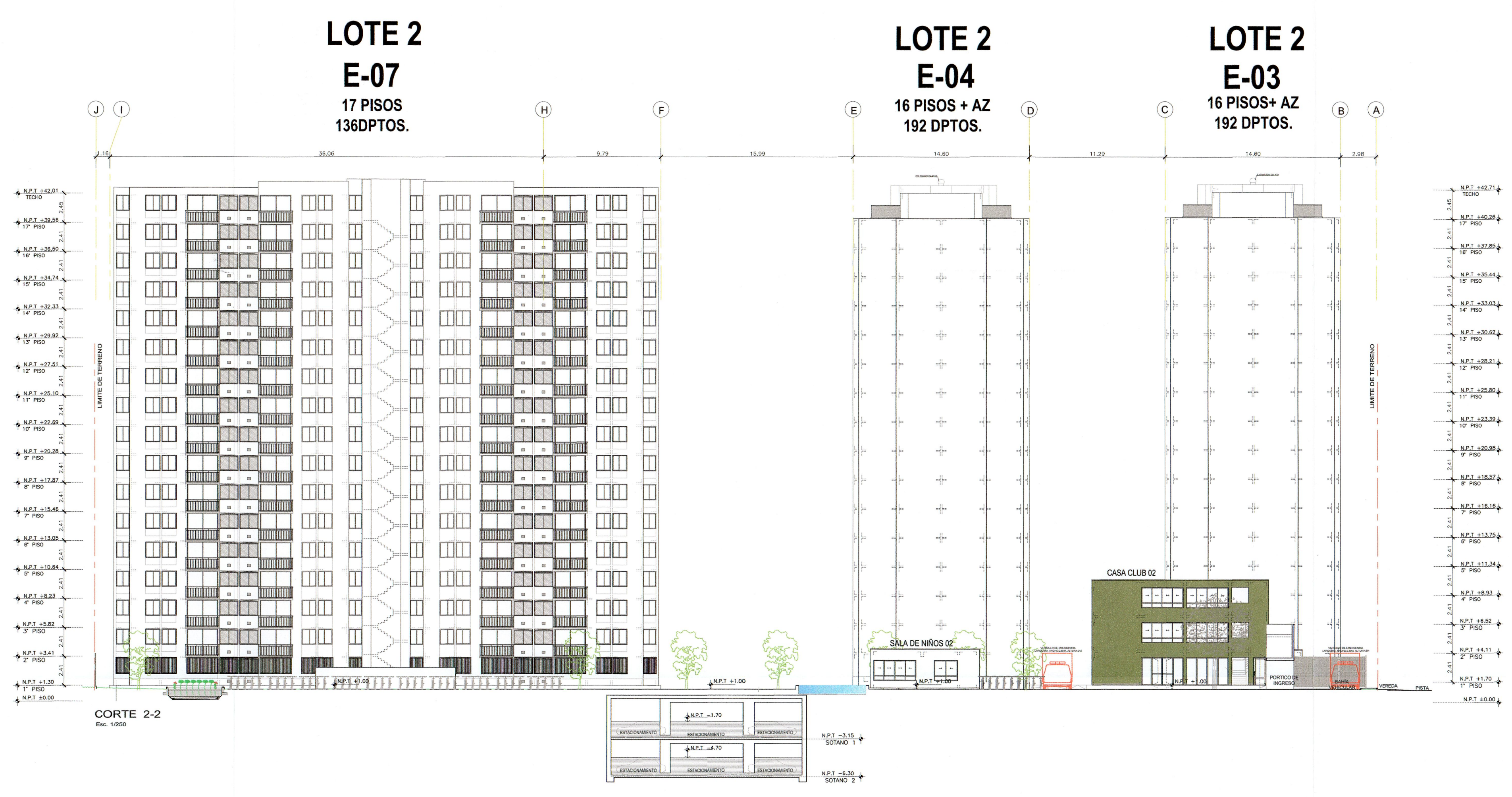
CORTE 2-2 Esc. 1:1000