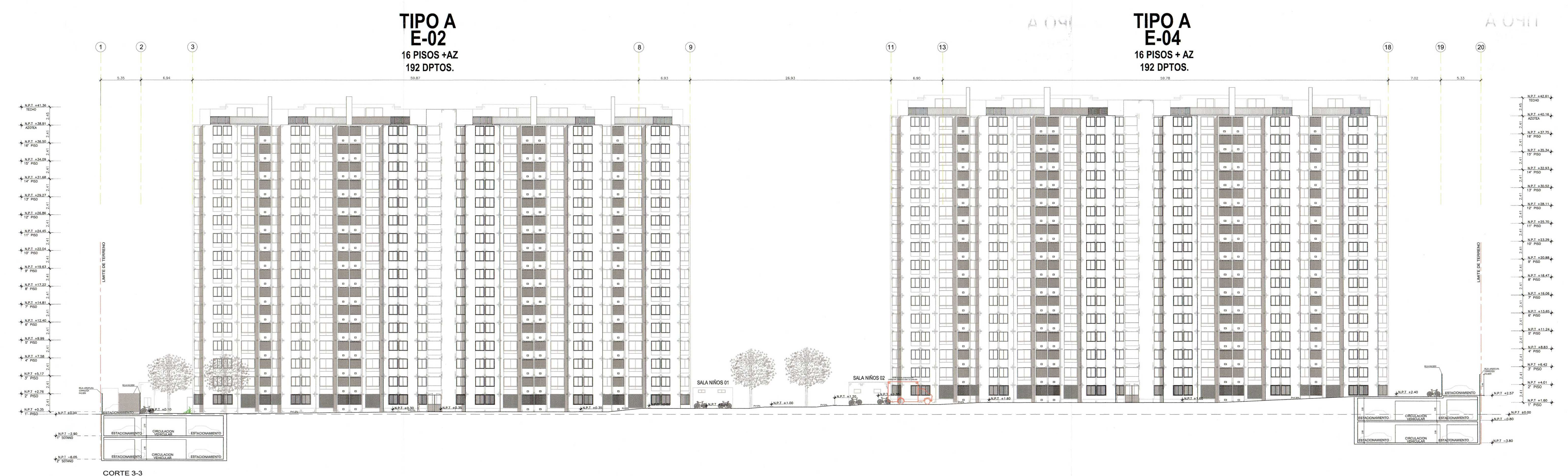
CORTE 3-3 Esc. 1:1000

UBICACION: AV. MARIANO GONZALES, ESQUINA CON CALLE 2 Y CALLES, LOS PARQUES DE COMAS, COMAS, LIMA, PERU