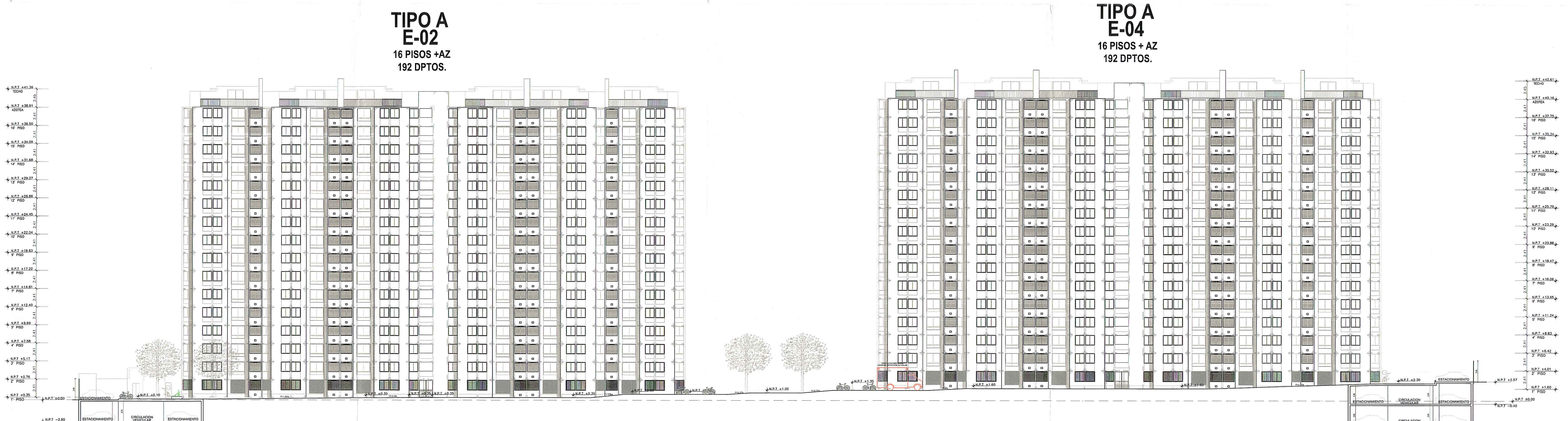
CORTE 3-3 Esc. 1/200