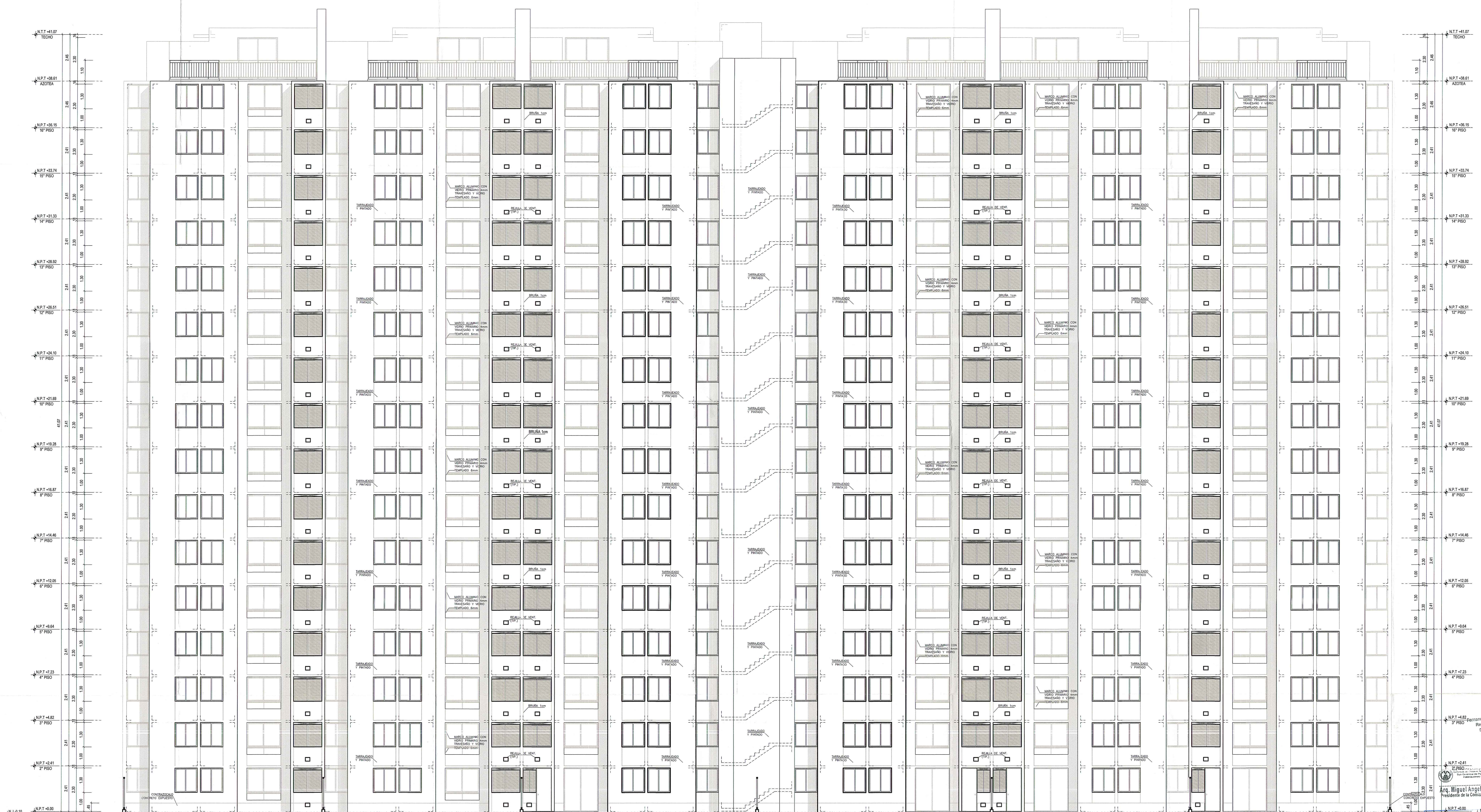
ELEVACION 2 - POSTERIOR EDIFICIO 1 Y 4 Esc. 1/75 EN CORTES Y ELEVACIONES NIVELES DE PISOS SUPERIORES CONSIDERAN NPT DE 1° PISO +0.00