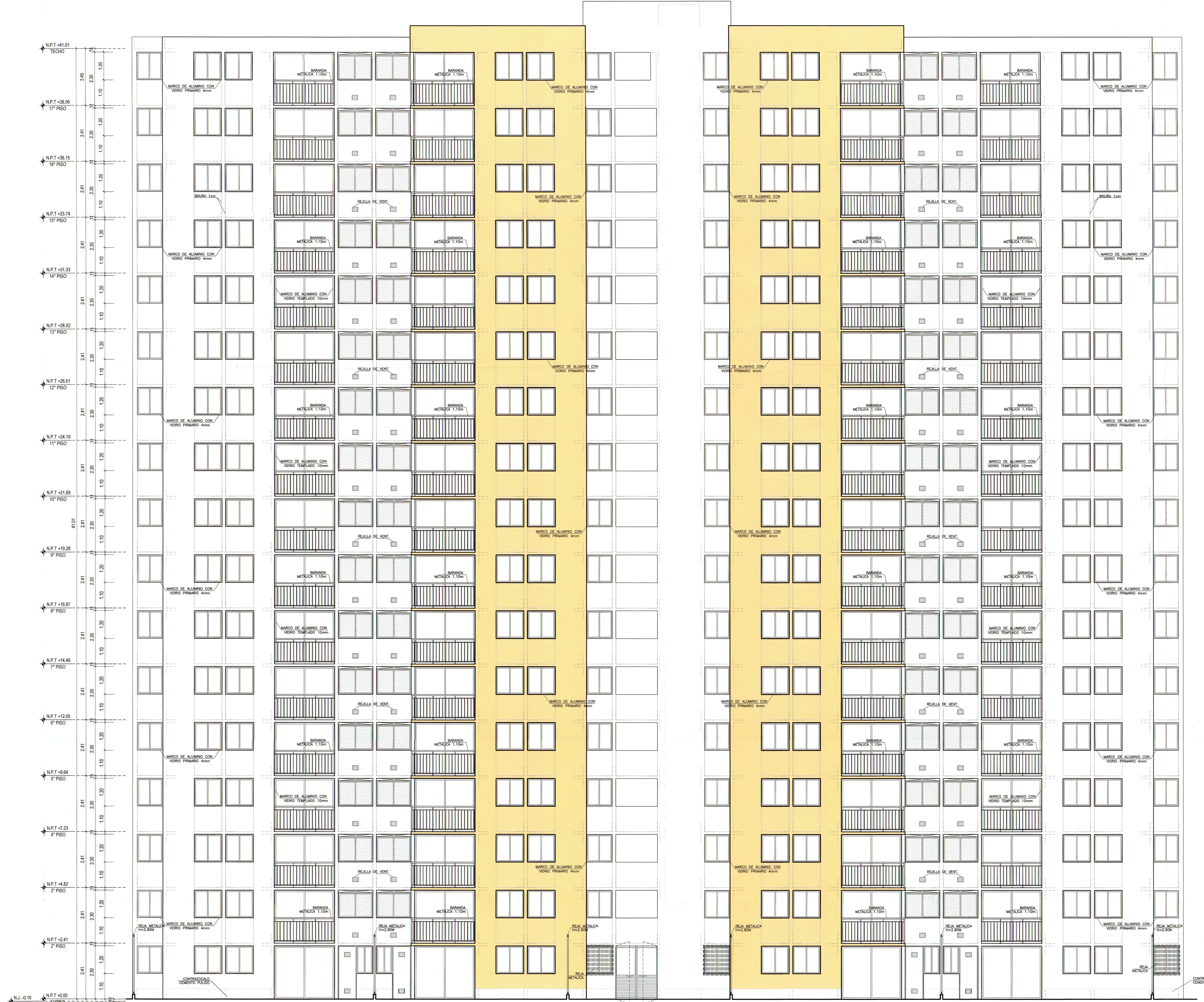
ELEVACION 1 - FRONTAL (EDIF. 7) ESC. 1/75

DI: 05/04/2024 | DPT: MUNICIPAL | Hoja: 1 | 02 PROYECTO: PIEDRA | DEPT. DE LA PIEDRA | REV: 02/2024