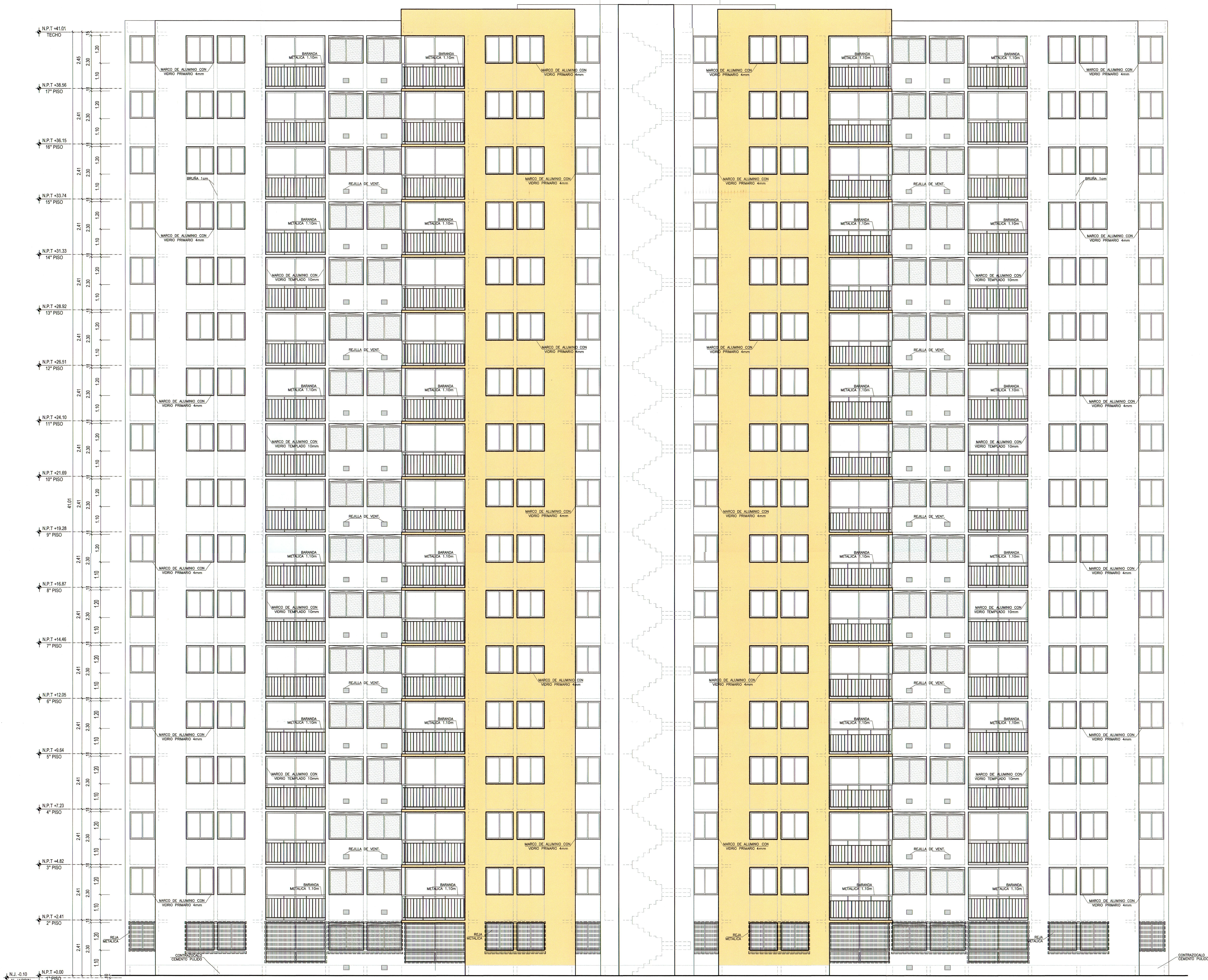
ELEVACION 2 - POSTERIOR (EDIF. 7) ESC. 1/75

AV. MARIANO GONZALES, ESQUINA CON CALLE 2 Y CALLES LOS PARQUES DE COMAS, COMAS, LIMA, PERU